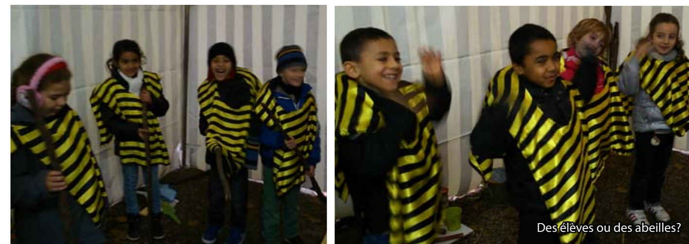
Des élèves ou des abeilles?