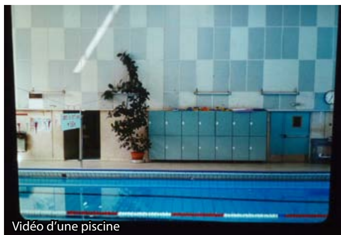
Vidéo d'une piscine

- Il y avait aussi une vidéo de la salle où on était.