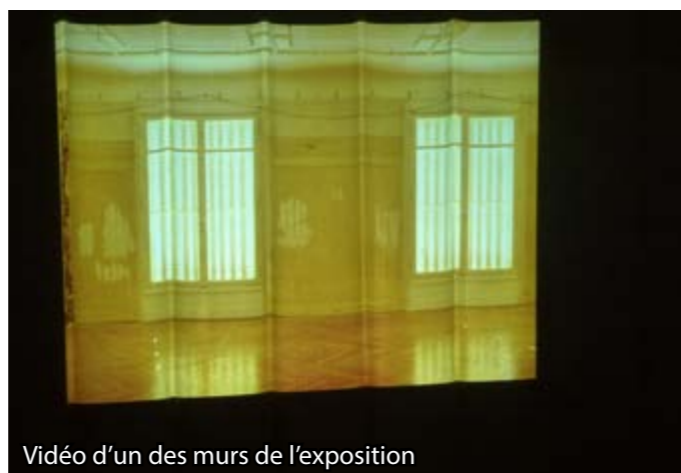
Vidéo d'un des murs de l'exposition